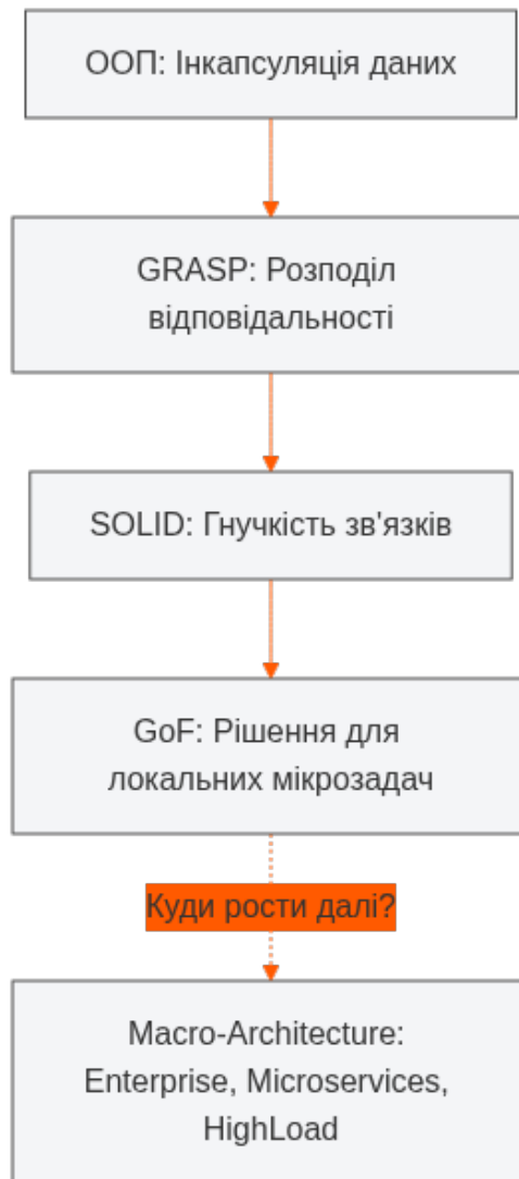
Рисунок 3. Піраміда архітектурного знання

Бачите логіку? Наша піраміда спускається від загальних архітектурних ідей все ближче і ближче “до землі” — тобто до вашого реального коду та серверів: